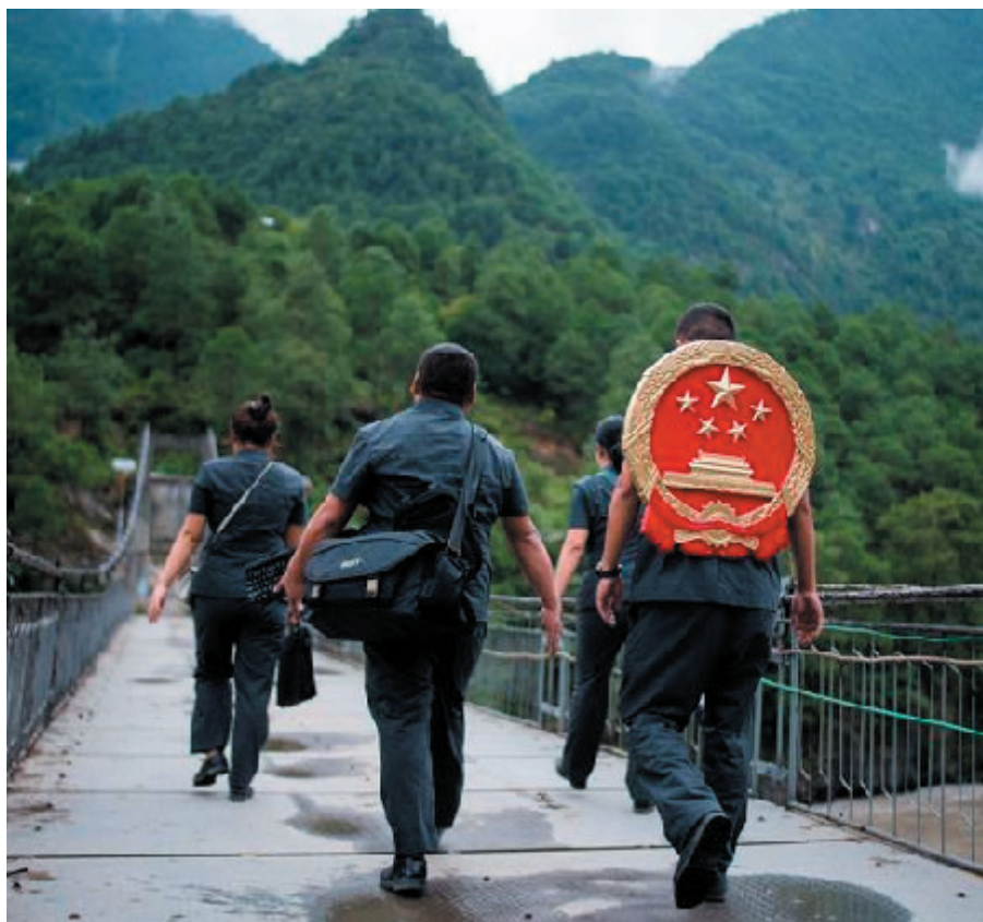
Magistrații guvernului chinez promovează statul de drept într-o regiune îndepărtată.

China va susține și va acționa pe baza principiului că apele limpezi și munții magnifici sunt bunuri de neprețuit și trebuie să ne amintim să menținem armonia dintre umanitate și natură atunci când ne planificăm dezvoltarea.