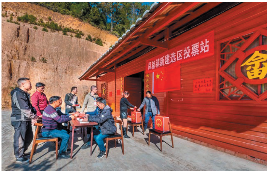
Democrația la nivel primar ca parte importantă în democrația poporului de-a lungul întregului proces. Imaginea arată peisajul unui punct de vot într-un sat din provincia Fujian, Sud-Estul Chinei.

Pentru a construi o țară socialistă modernă din toate punctele de vedere, trebuie, în primul rând, să urmărim o dezvoltare de înaltă calitate. Dezvoltarea este prioritatea principală a partidului în guvernarea și întinerirea Chinei, deoarece fără baze materiale și tehnologice solide, nu putem spera